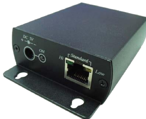
Рис. 1 Внешний вид устройства SR01