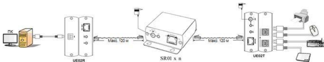
Рис. 4 Схема подключения SR01 совместно с UE02.