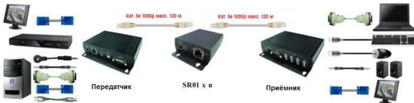
Рис. 5 Схема подключения SR01 совместно с VKM03.